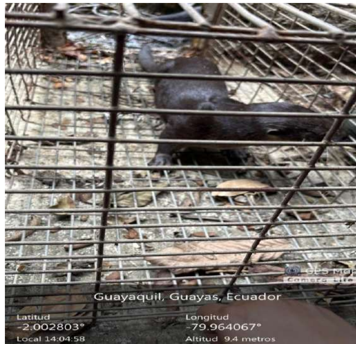
Figura 7. Condicionamiento operante en hembra Nutella, comando Dentro. Santos, 2026