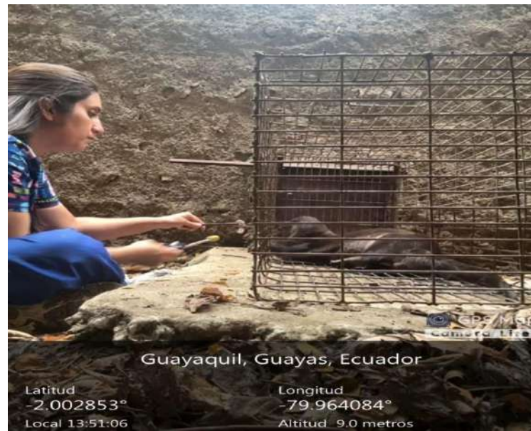
Figura 11. Asociación al comando abajo en el macho Blue. Santos, 2026