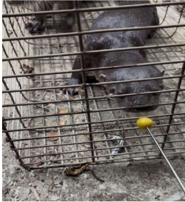
Figura 3. Desensibilización a la herramienta Target a través de la jaula de manejo.