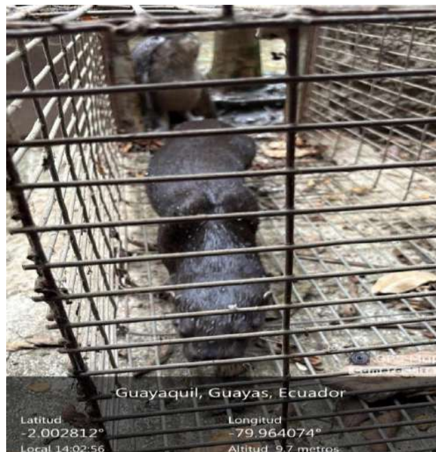
Figura 6. Condicionamiento operante, implementación del comando Dentro, en dos ejemplares, hembra y macho.