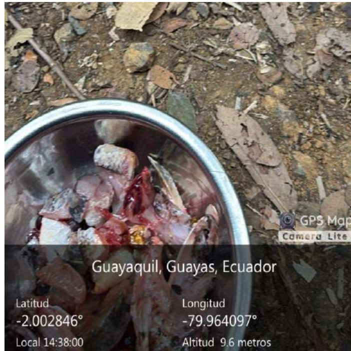
Figura 5. Porciones de alimento como refuerzo positivo, en la etapa de entrenamiento para el condicionamiento operante.