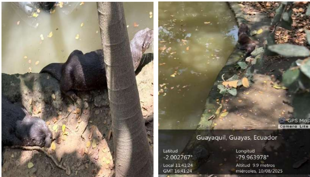
Figura 1. Etapa de observación de los tres ejemplares de Nutria neotropical ( Lontra longicaudis ) a la izquierda una hembra y un macho (Cho y Blue) y derecha otra hembra (Nutella) en Zoológico El Pantanal.