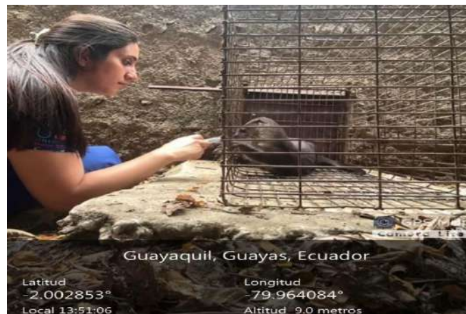
Figura 10. Asociación al comando quieta para recibir vitaminas o medicación necesaria.