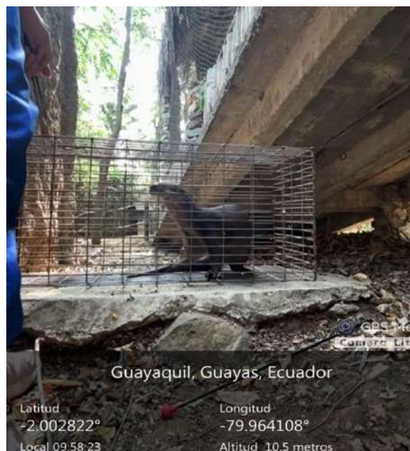
Figura 2. Condicionamiento operante en nutria hembra, “Nutella” adaptación a la presencia del investigador a las nutrias, con porciones de alimento.