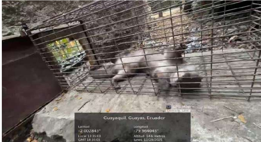
Figura 9. Condicionamiento operante, comando Gira en hembra Cho en zoológico el Pantanal.