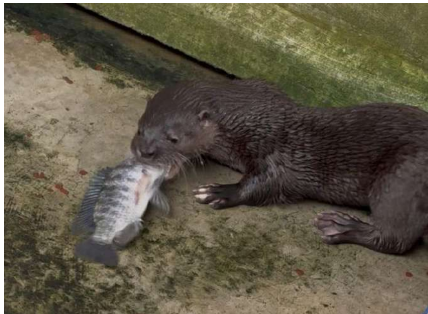
Figura 12. Implementación de enriquecimiento alimenticio a hembra "Nutella". Santos, 2026