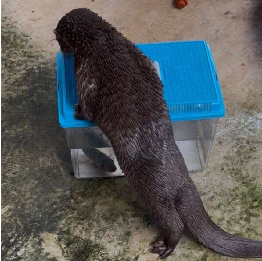
Figura 13. Hembra Nutella con el enriquecimiento alimenticio, tilapia viva en su piscina.