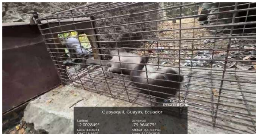
Figura 8. Condicionamiento operante, macho Blue en la aplicación del comando Gira.